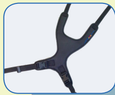
Brustschultergurt für Mädchen und Jungen