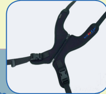
Durch die individuelle Einstellung der einzelnen Gurte kann der Brustschultergurt je nach Krankheitsbild angepasst werden