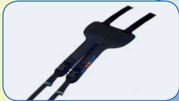
Die Sitzhose dient der Beckenpositionierung von Personen in Sitzschalen oder Rollstühlen