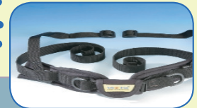
Der Beckengurt dient zur Positionierung von sitzenden Personen im Rollstuhl oder in einer Sitzschale